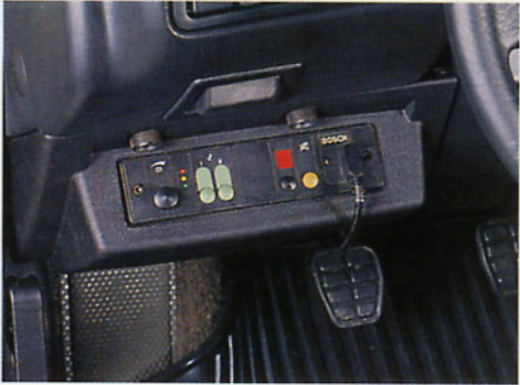
Ebenfalls im Umfang der Taxi-Grundausrüstung enthalten ist die Einbauvorrichtung für das Funkgerät unter der Schalttafel links.