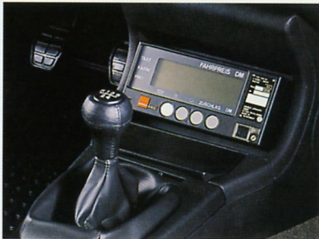
Die große Mittelkonsole bietet den idealen Platz für den Einbau des Taxameters. Die Einbauvorrichtung gehört zur Taxi-Grundausrüstung.