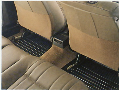
Der Passat bietet den Fahrgästen großzügige Raumverhältnisse. Zur praktischen Taxi-Grundausrüstung gehört der Trittschutz an den Rückenlehnen der Vordersitze.