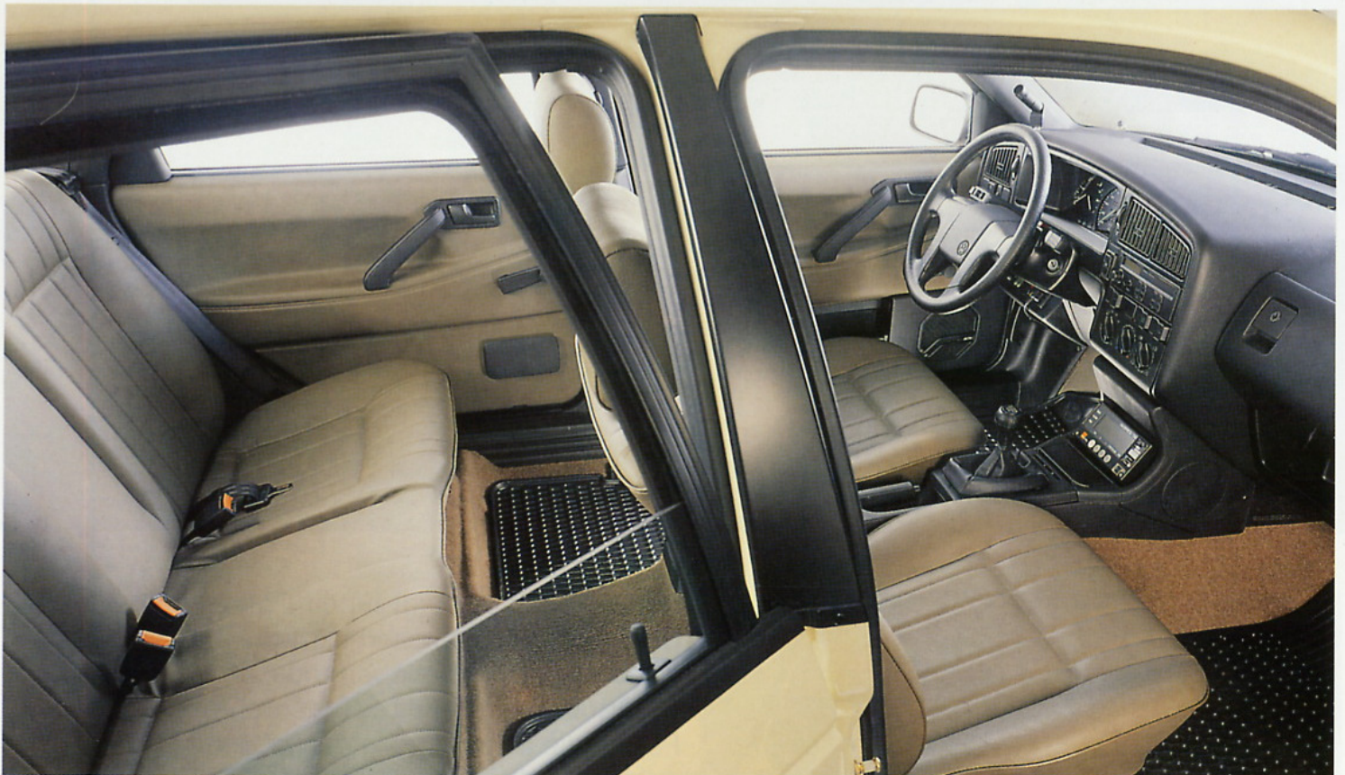
Mit einer Innenraumlänge von über zwei Metern überragt der Passat sogar noch viele, die außen viel größer sind. Radio ist Extra.