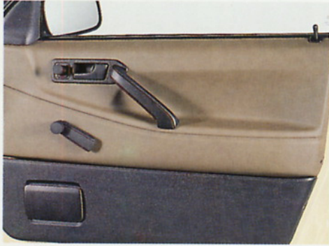
Die Türen sind innen mit strapazierfähigem Kunststoff verkleidet. Die großen Ascher sind Bestandteil der Taxi-Grundausrüstung.