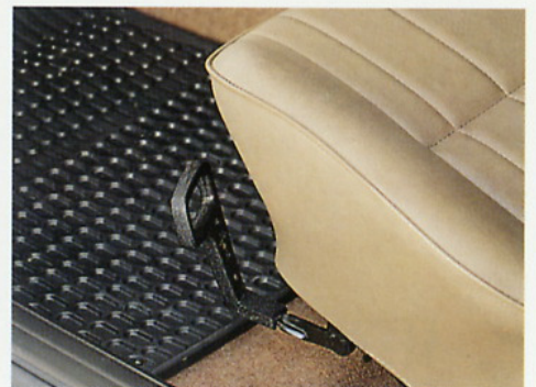
Der höhenverstellbare Fahrersitz bietet für jede Fahrergröße eine optimale Sitzposition und einen hohen Sitzkomfort.